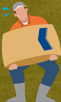
ビーラム® 粒剤 20kg