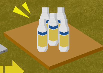
ビーラム® プライムフロアブル 5ℓ (1ℓ×5本)