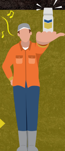
ビーラム® プライムフロアブル 250ml